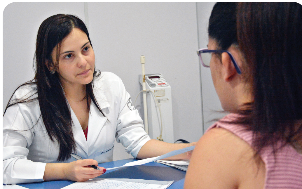
A rede de saúde de Horizonte realizou mais de 250 mil atendimentos em 2017.