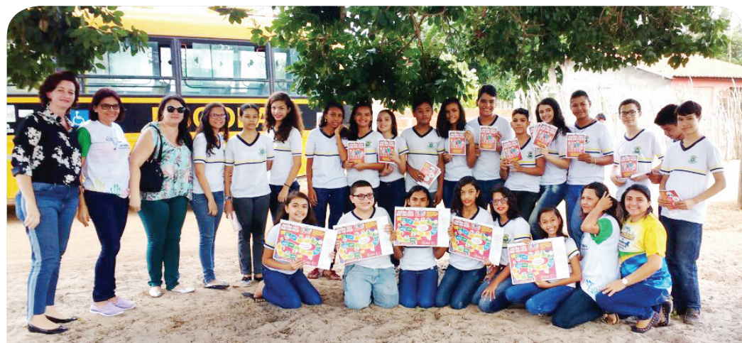
Estudantes saem das salas de aula e orientam a população sobre a prevenção ao mosquito.