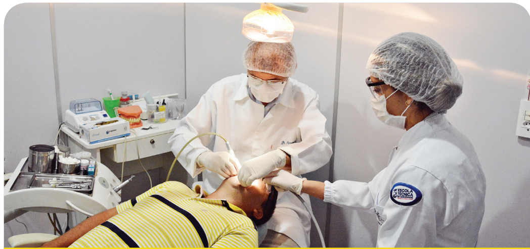
O CEO realiza procedimentos mais complexos, que não podem ser realizados nos postos.

O Cerest também investiu nas campanhas de prevenção, com destaque para o Julho Amarelo (hepatites virais), o "28 de Julho" (acidentes de trabalho), o Outubro Rosa (câncer de mama), o Novembro Azul (saúde do homem), e o Dezembro Vermelho (HIV).