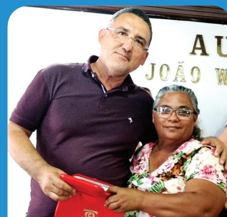
Beneficiários tem renda de até R$330.