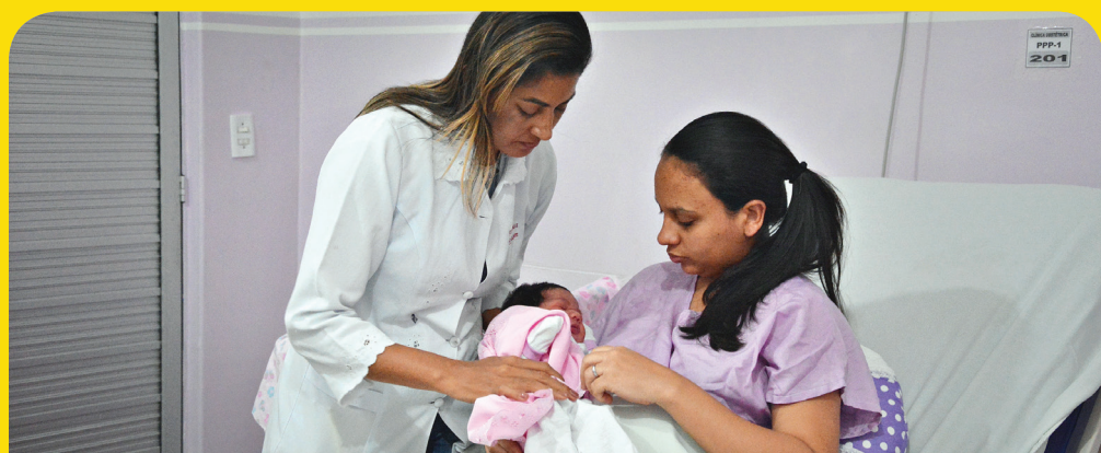
No Hospital Municipal, as mães contam com atenção e cuidados antes e depois do parto.

E as mulheres que recebem ajuda, também podem ajudar. Em outubro, Horizonte enviou 49 litros de leite para o Hospital Infantil Albert Sabin, suprimindo 45,2% da necessidade da unidade. No acumulado do ano, foram doados mais de 250 litros de leite. Nosso muito obrigado a todas as doadoras.