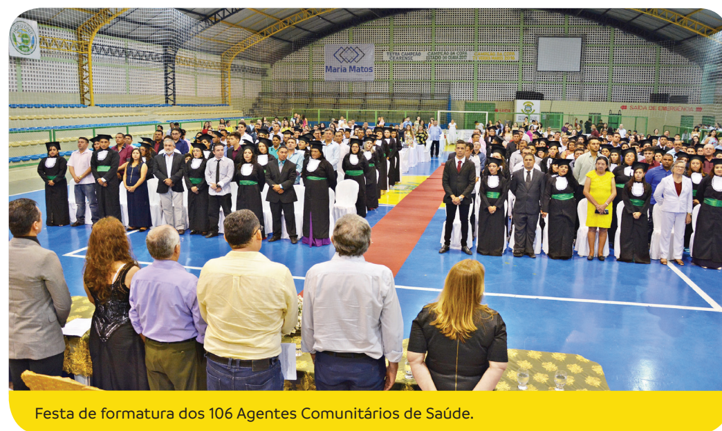
Festa de formatura dos 106 Agentes Comunitários de Saúde.

Outra parceria importante renovada foi com a fábrica Ford/Troller com o Programa Odontomóvel para atendimento odontológico gratuito para alunos da rede pública. O Odontomóvel é um consultório montado sobre um caminhão Ford com estrutura completa de última