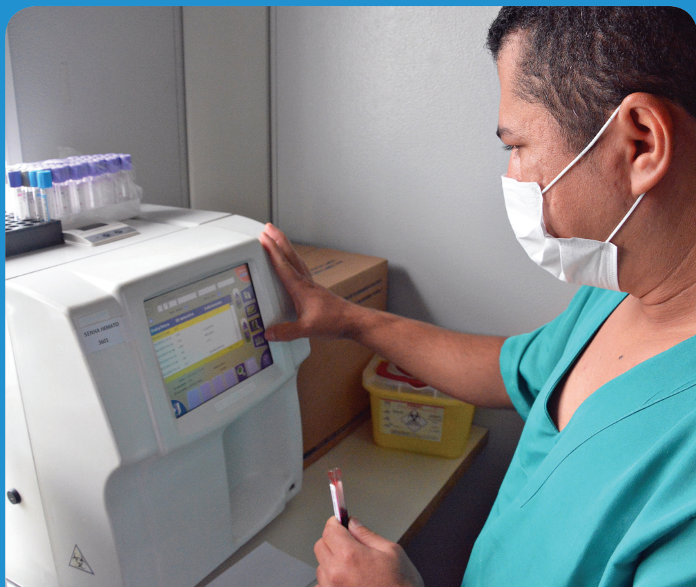
Neste ano, foi implantado um laboratório de análises clínicas 24 horas dentro da UPA.

Também foram adquiridos novos aparelhos, como o eletrocardiograma, e realizadas melhorias no espaço físico para que a Unidade se adequasse às exigências do Ministério da Saúde. Entre elas, a sinalização do piso para agilizar o deslocamento e a reformulação das salas de medicação pediátrica e adulta, que foram ampliadas para aumentar a capacidade de atendimento.