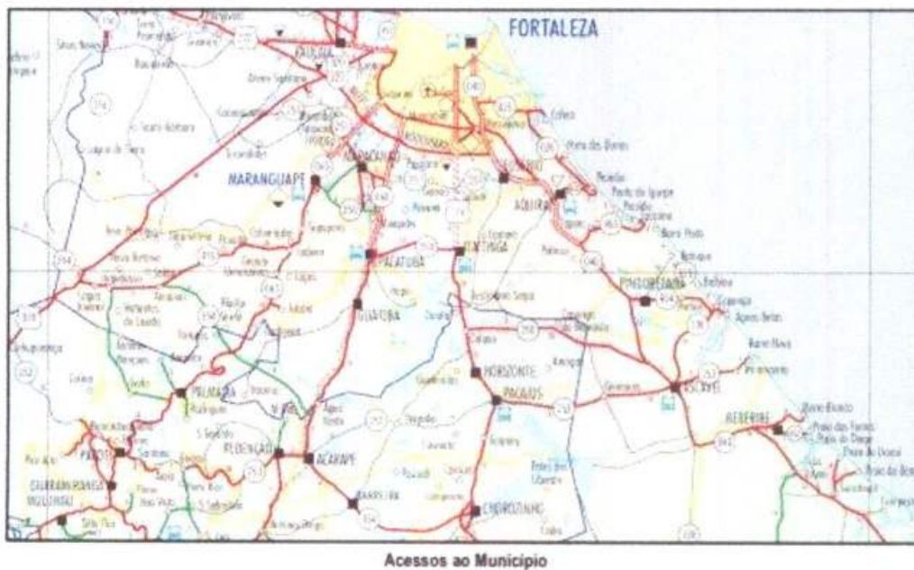
Acessos ao Município