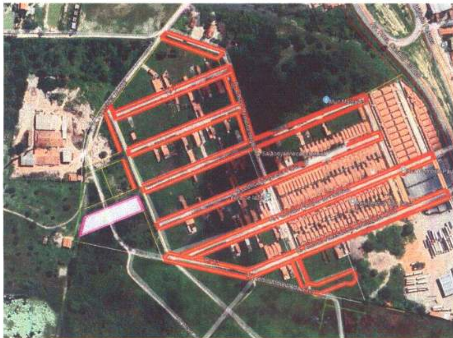
Imagem 01: foto aérea do terreno situado à Rua 09 Loteamento Urbania